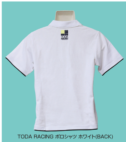
TODA RACING ポロシャツ ホワイト(BACK)

半袖ポロシャツの販売を始めました。吸汗速乾素材を採用し 汗をすばやく吸収 拡散し、外部へ放出、内部をドライな状態に保ち、着ごち最高です。