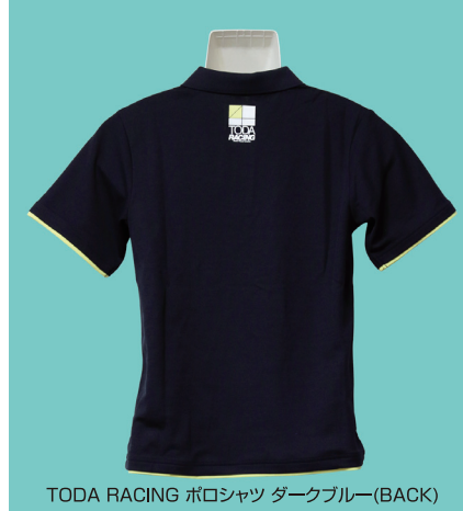
TODA RACING ポロシャツ ダークブルー(BACK)