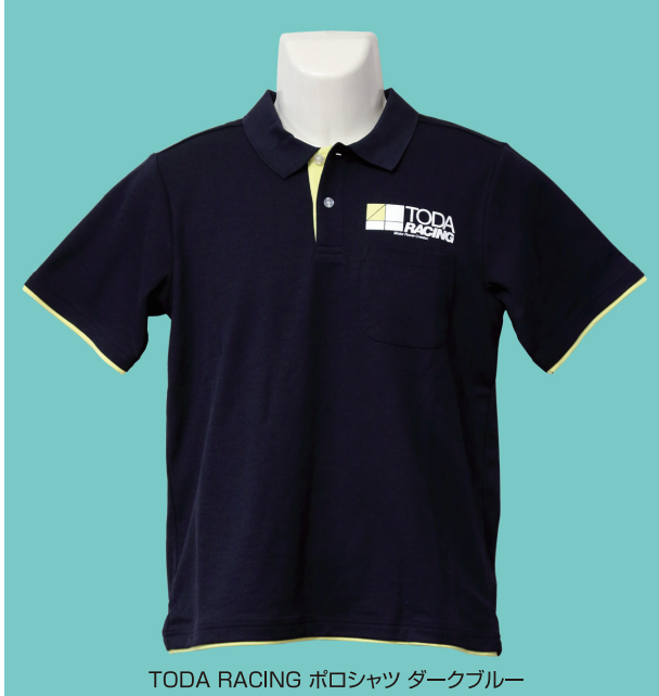
TODA RACING ポロシャツ ダークブルー