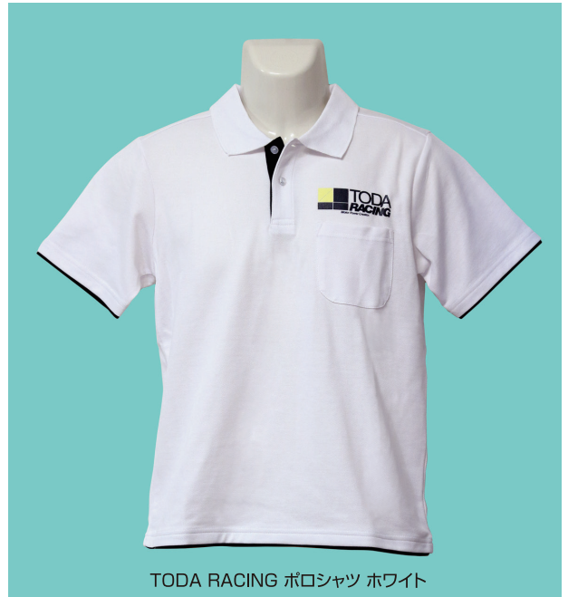
TODA RACING ポロシャツ ホワイト