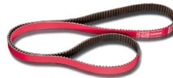
C30A/C32B ■ 06141-NSX-000