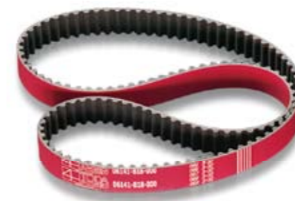
B18C ■ 06141-B18-000