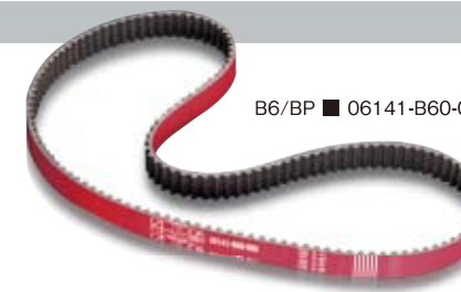
B6/BP ■ 06141-B60-000