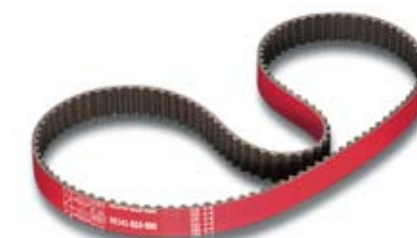
B16A ■ 06141-B16-000