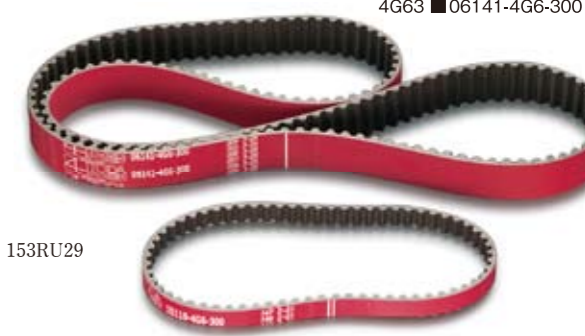
4G63 ■ 06141-4G6-300