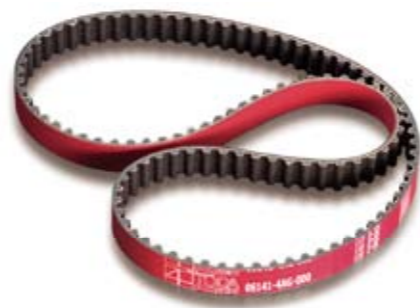
4AG ■ 06141-4AG-000