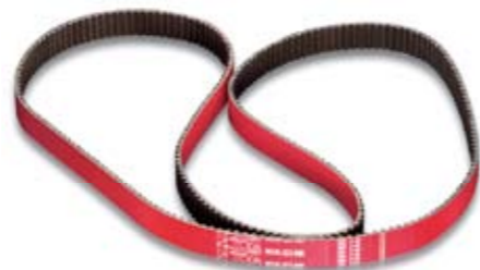
EJ20 ■ 06141-EJ2-000