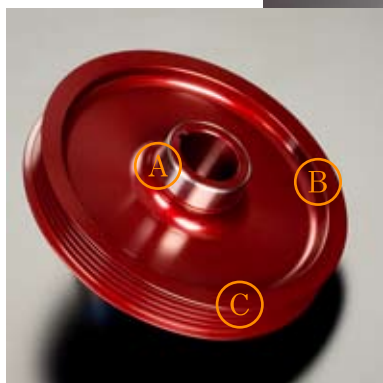
■ フロント クランクプーリー 背面