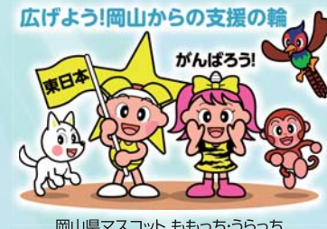
岡山県マスコット ももっちゃんらっちゃん