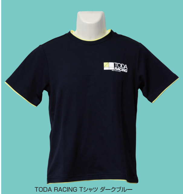
TODA RACING Tシャツ ダークブルー