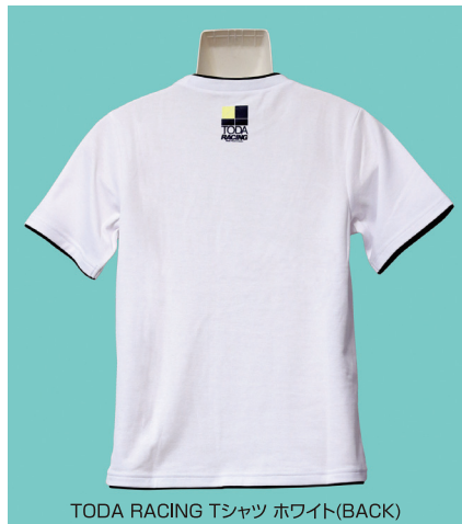
TODA RACING Tシャツ ホワイト(BACK)