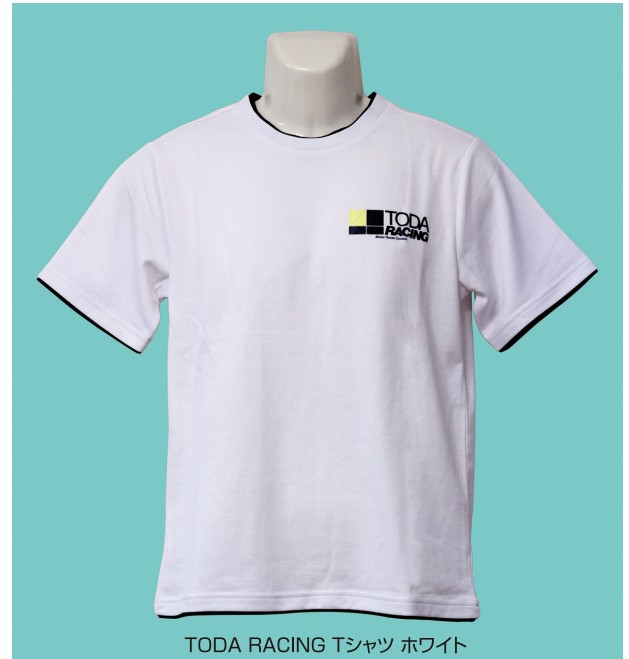
TODA RACING Tシャツ ホワイト